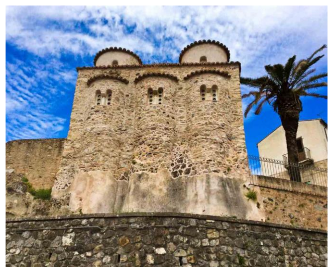
CHIESA DI SAN MARCO