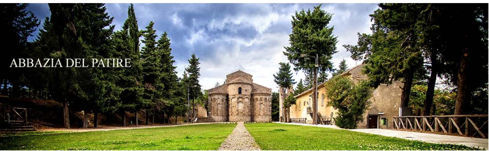
ABBAZIA DEL PATIRE