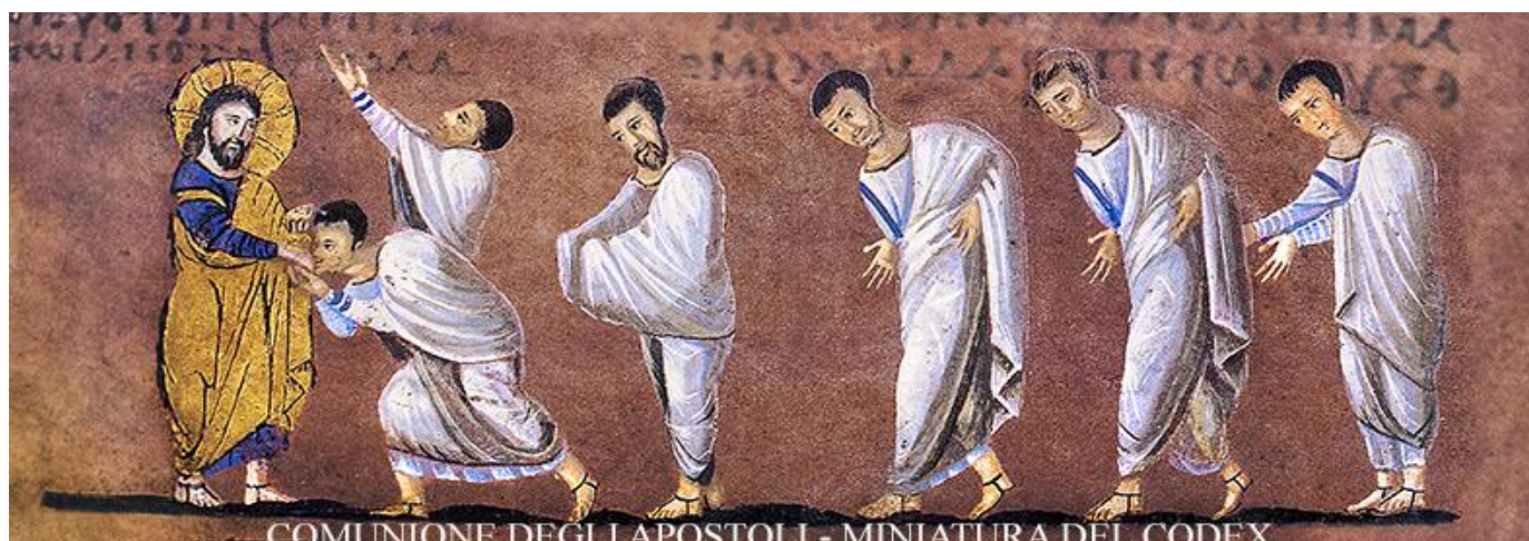
COMUNIONE DEGLI APOSTOLI - MINIATURA DEL CODEX